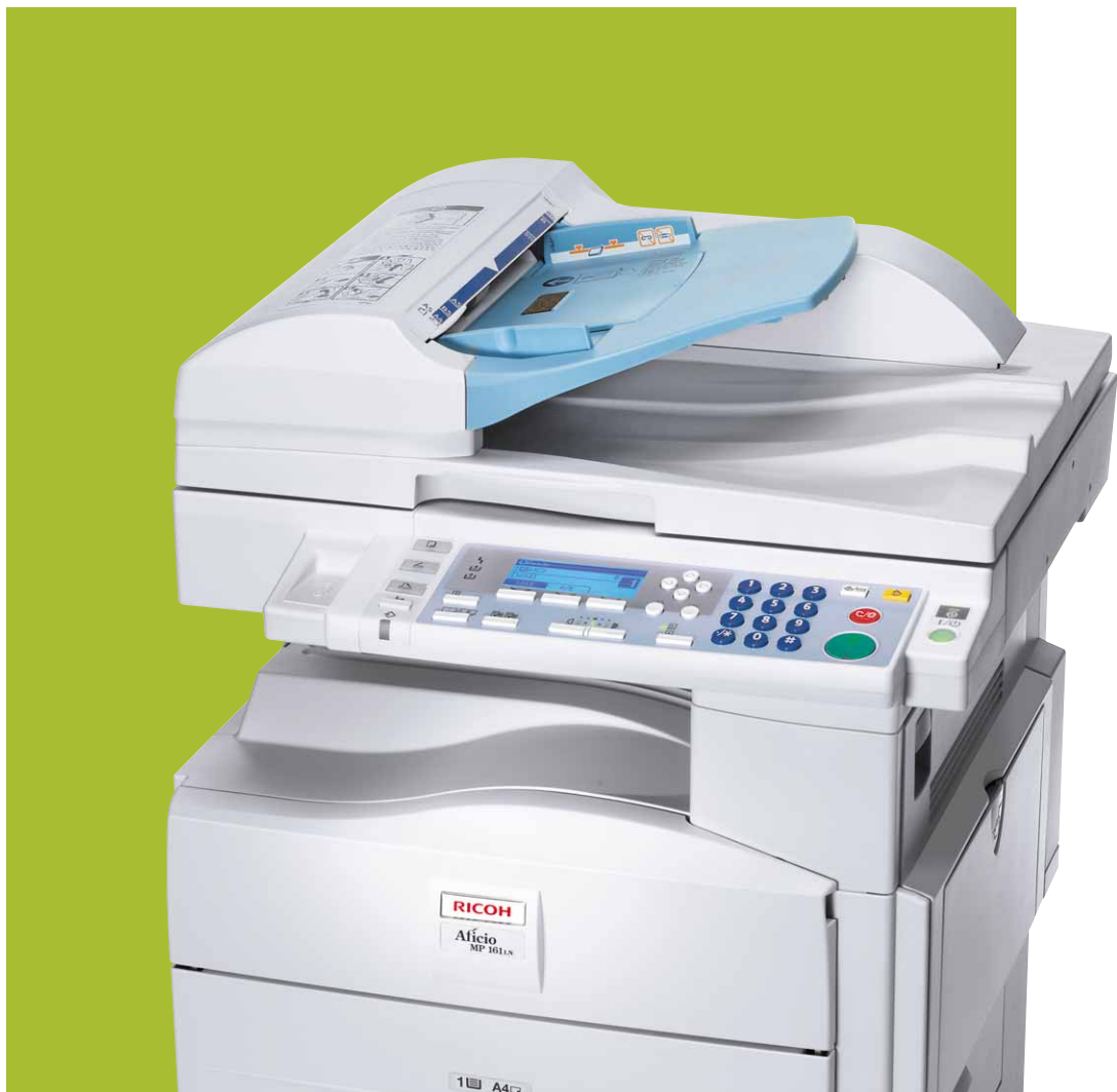
Aficio™ MP 161/MP 161L/MP 161LN

Copieur recto verso, imprimante, scanner couleur : Plus de fonctionnalités à moindre coût !